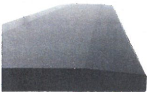
Mit dem »LCV-ST« erstellter Schnitt