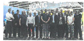
Das König/Schmieder-Messteam

Die Firma König präsentiert auf der Marmomac ein neues Standkonzept. Der Stand wird in mehrere Bereiche eingeteilt, in denen u.a. Lösungen für die Naturstein- und Keramikbearbeitung präsentiert werden. Ein Highlight wird das »Jöst P1 staubfrei«-Schleifsystem sein. Die Besucher können sich live ansehen, wie mit dem Schleifsystem direkt durch das Diamantpad und über die Haube abgesaugt wird – ohne Staubbelastung für Mensch und Umwelt. Außerdem zeigt König vielfältige Möglichkeiten, Oberflächen zu bearbeiten. In einer Demo-Arena können die Besucher Werkzeuge selbst ausprobieren. Mitarbeiter zeigen, wie jedes Werkzeug mit dem Adaptersystem auf alle gängigen Maschinentypen montiert werden kann. Königs Partner Omni-