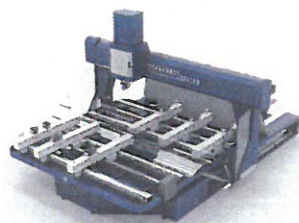
Fotomontage des Bearbeitungszentrums »BAZ595D A-Tisch«, das in Verona erstmals vorgestellt wird.

integrierte Konsolen-Arbeits-tischen. Die Konsolen lassen sich durch ein LED-gesteuertes Positioniersystem mit Saugern ausrichten. Ein automatischer Drehtisch ermöglicht es, die Maschine während Bearbeitungsvorgängen zu bestücken.