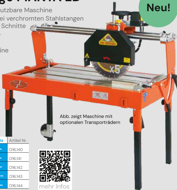
Abb. zeigt Maschine mit optionalen Transporträdern

[ Drehzahl 2.800 U/min | Leistung 2,2 kW | Spannung 230 V | Trennscheibendurchmesser 350 mm | Bohrungsdurchmesser 25,4 mm ]